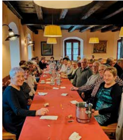
Fiesta local de Etxalar

En el mes de marzo o de abril se celebran los campeonatos de mus entre los ganadores de los campeonatos locales. Participan también los segundos y terceros de los campeonatos locales. Normalmente toman parte 32 parejas.