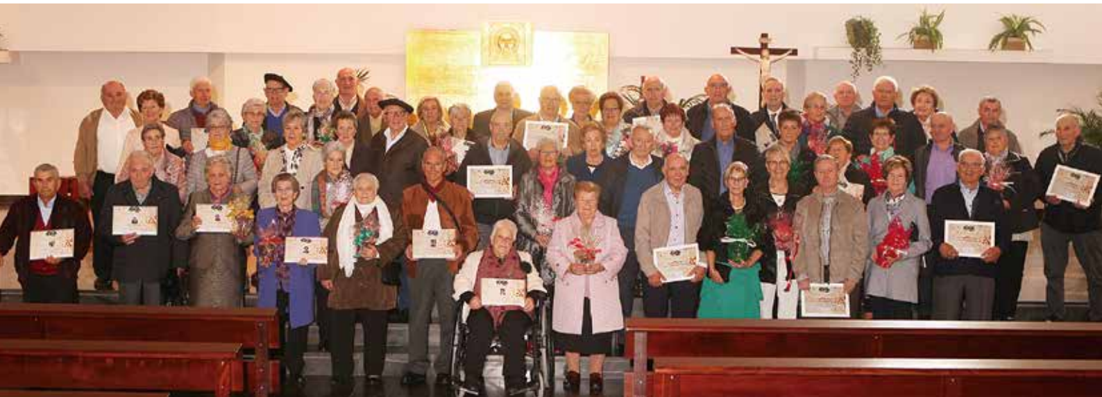
Día del Socio y Homenajes en Gorraiz

En resumen, fueron 11 los centenarios-as, 18 bodas de diamante, 154 bodas de oro y 371 mayores de 85 años.