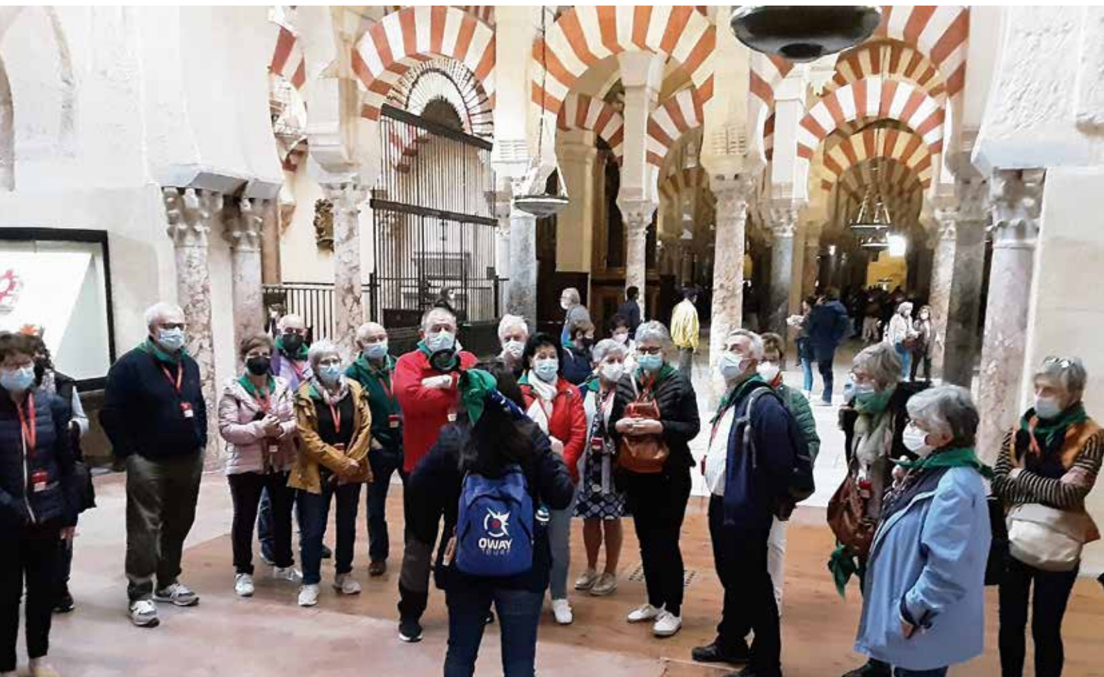
Mezquita de Córdoba

Tal como se señaló en el capítulo anterior de la historia de Arkupeak, se han repetido anualmente: los viajes religiosos a Xabier-Lourdes-Aralar-Lezo-Aranzazu, los campeonatos de mus, el día de la gimnasia, Día del Socio y homenajes, visita a Lodosa y Estella y a los Pirineos.