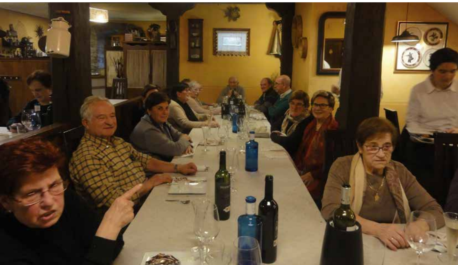
Fiesta local de Ituren