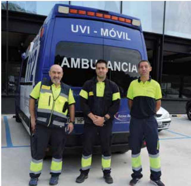
Ambulancia en Dantxarinea