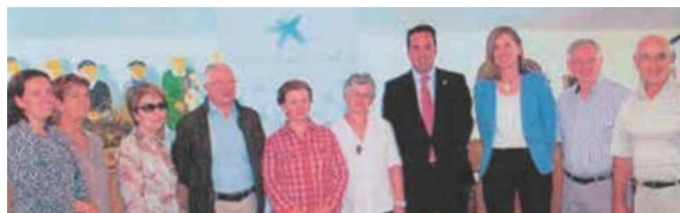
Gizarte Politiketako kontseilaria, “la Caixa”-ko arduradunak eta Arkupeak-eko Zuzendaritza Batzordeko kideak

Programa honen helburua da: “informazioaren teknologiari buruzko prestakuntza jarduerak egitea, zahartze aktiboaren eta boluntarioria programa baten bidez osasuna sustatzea”.