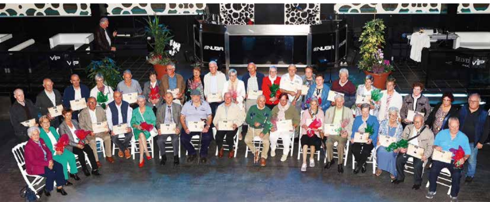
Día del Socio y Homenajes en Dantxarinea