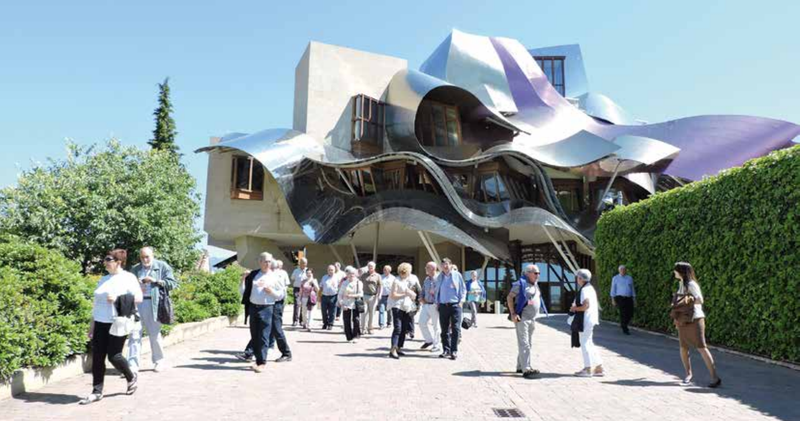
Bodega Marqués de Riscal, Elciego- Alava