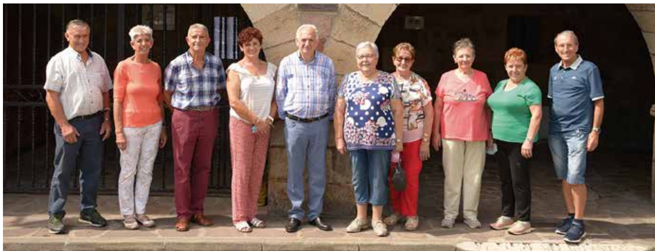
2019an izendatutako Zuzendaritza Batzordea

Bi garai horietan, honako hauek nabarmen-tzen dira: inguruko kiroldegiekin egindako hitzarmenak, ia hilero egiten diren bidaiak, deskontuak dituzten ikastaroak, lehiaketak eta aipatutako batzorde ekonomikoaren aparteko lana diru laguntzak lortzeko, ahalik eta jarduera gehien eskaini ahal izateko. Nafarroako Gobernuaren dirulaguntzarik handiena lortu zuen probintzietako elkarteetako bat izan zen.