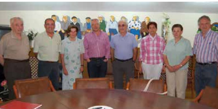
2011n izendatutako Zuzendaritza Batzordea