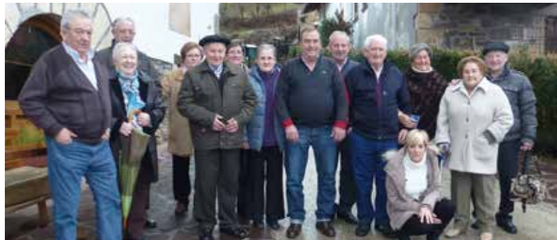
Herriko bestak Ezkurran