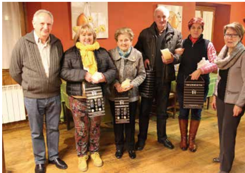
Herriko mus txapelketa Donamarian