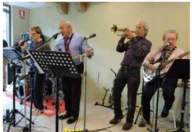
Actuación del grupo Guateke

No debemos olvidarnos de los socios voluntarios que trabajan en silencio ayudando a