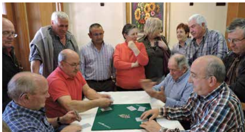
Herriko mus finala Donezteben