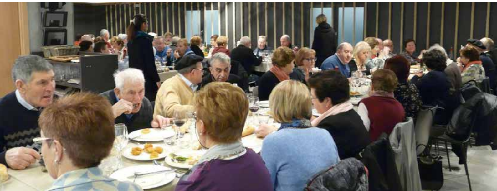
Fiesta local de Bera e Irun