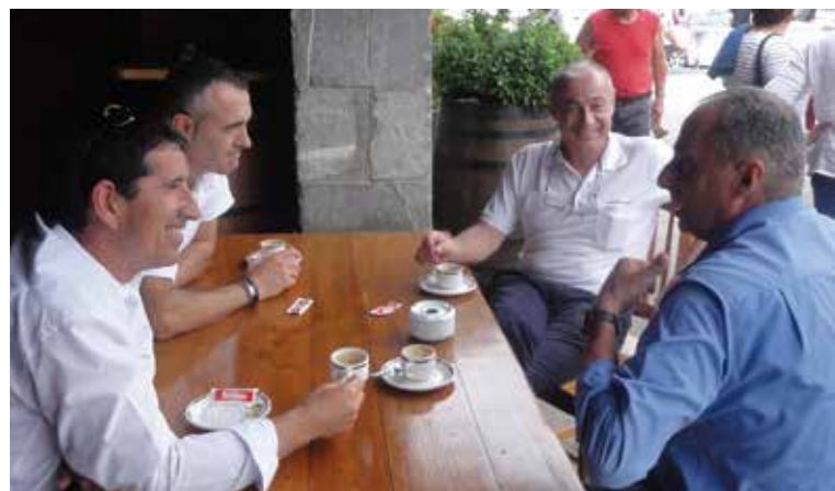
Leizaran eta "La baztanesa"-ko autobus gidariak