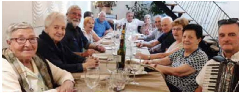
Herriko bestak Arantzán

Muslariek, goizeko 9,30etan, bikoteen zozketa egin ondoren, hasten dira "lanean". 11:00k aldera, zerbait dastatzeko atsedena hartzen da eta ordu biak aldera bukatzen dira partidak. Bazkalondoan sariak banatzen zaizkie txapeldunei, bigarrenei, eta baita hirugarrenei ere.