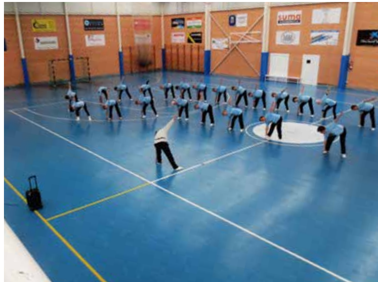
Día de la gimnasia en Santesteban