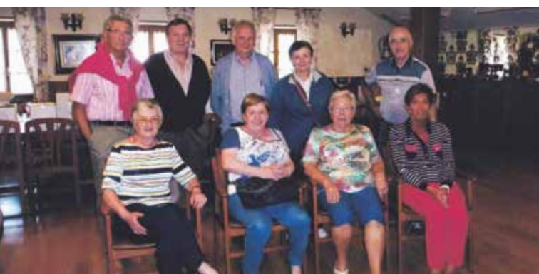
2015ean izendatutako Zuzendaritza Batzordea