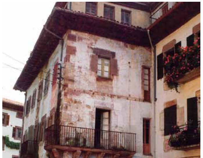
Asilo edo Erruki Etxe zaharra, Doneztebeko Rosa Seminario karrikan