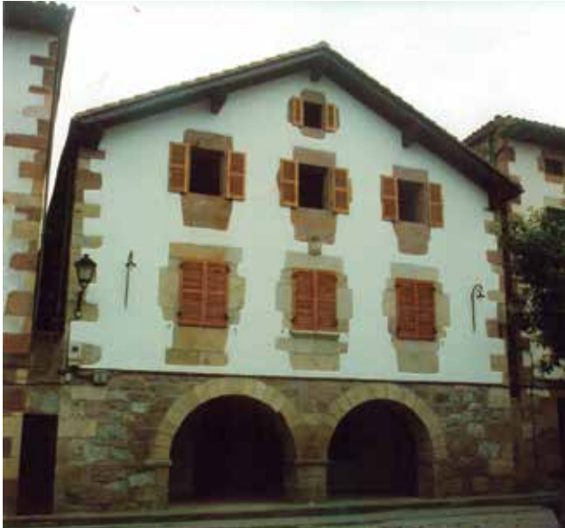
Doneztebeko Udaletxe zaharra, gaur egungo bulegoak

Arkupeak-en hasieratik, kezkarik handiena eta buru-belarri borrokatu zutena Donezteben jubilatuen egoitza bat sortzea izan zen, batez ere Malerrekako adinekoentzat.