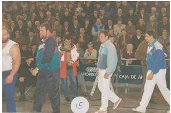
1993an, Herri kirolen jaialdia, Anaitasun eta Omenaldien Egunean.

2011n, gure kirolari handiei omenaldia, Arkupeak zilarrezko ezteiak ospatu zituen egunean.