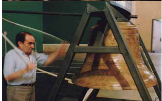
Pelotaris y Cote San Martín repicando campanas