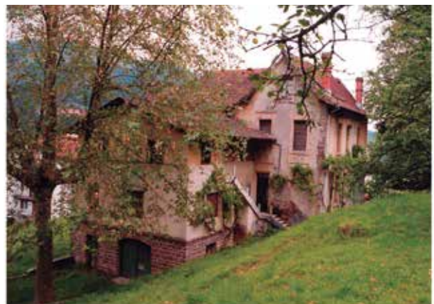
Pantxoenea, Doneztebeko Aranzoko alderdiko bidean