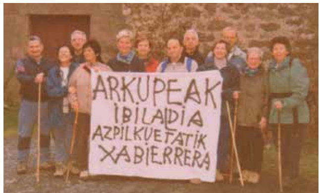
Azpilkuetako Dorre etxea

Xabierko San Frantziskoren jaiotzaren 500 urteurrena zela eta, Arkupeak-ek haren ama Maria Azpilkuetakoa gogoratu nahi izan zuen, Casa Torre jauregian bizi izana baitzen. Aita hil zitzaionean, “Azpilkueta jauregiko andere” bihurtu zen. Jauregi hura suntsitu ondoren, gaur egungo Dorre Berria hondakinen gainean eraiki zen 1741ean.