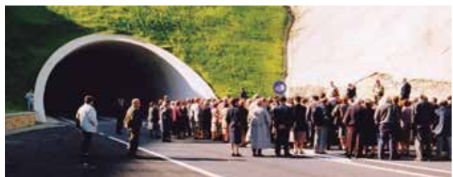
Visita a los túneles de Belate